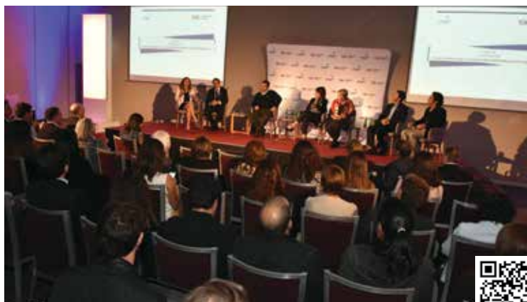
SEMINARIO DESARROLLO PRODUCTIVO, CAMBIOS SOCIALES Y CONSERVACIÓN: APRENDIZAJES DE CALIFORNIA, OPORTUNIDADES PARA CHILE

Más de 120 videos se pueden encontrar en el canal de AmCham en Youtube, que en total suman más de 19.000 visualizaciones. Entrevistas a socios, resúmenes de eventos y exposiciones son parte de los contenidos que están disponibles para los usuarios interesados en los registros audiovisuales de la Cámara. Te invitamos a conocer parte de la experiencia AmCham, para lo cual sólo tienes que escanear los códigos QR desde la pantalla de tu celular.