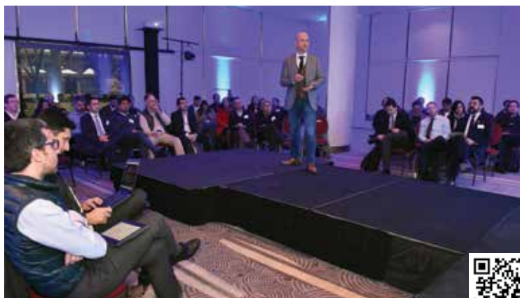
ENCUENTRO INTELIGENCIA ARTIFICIAL: CAMBIO DE PARADIGMA EN LOS NEGOCIOS