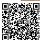
ENCUENTRO DE NETWORKING CON SOCIOS EN TARDE DE SIBARITAS