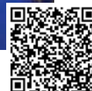
LANZAMIENTO DE CÍRCULO DE MENTORÍA EN DIVERSIDAD E INCLUSIÓN