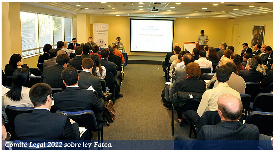
Comité Legal 2012 sobre ley Fatca.

La actividad de los Comités de AmCham demostró nuevamente ser una instancia para que los socios pudieran acceder a información de gran valor estratégico, discutir con oradores de gran nivel y experiencia en los distintos rubros y conocer personas de sectores o intereses similares.