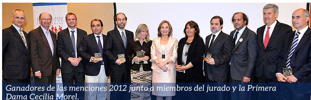
Ganadores de las menciones 2012 junto a miembros del jurado y la Primera Dama Cecilia Morel.