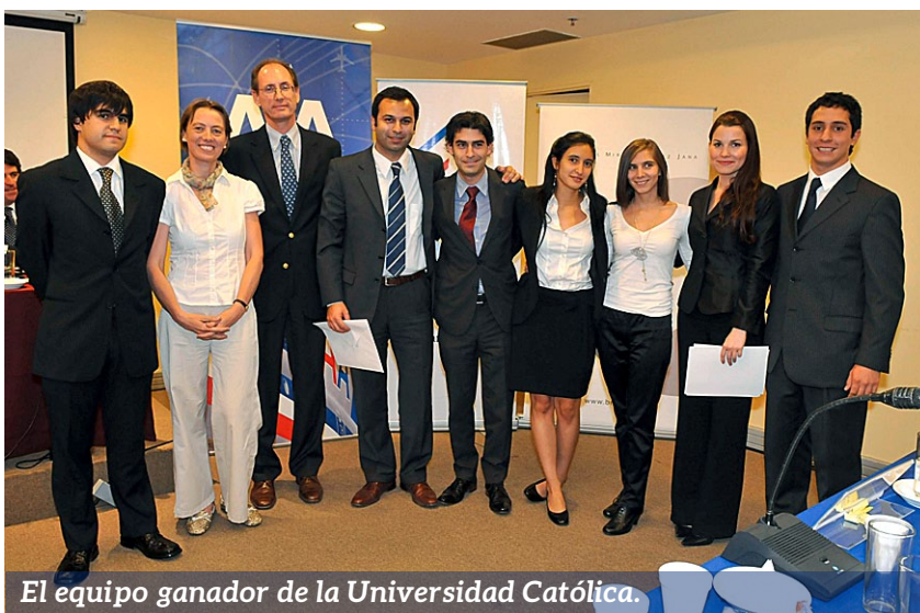
El equipo ganador de la Universidad Católica.

Por último AmCham agradece a Grasty, Quintana, Majlis y Cía., estudio que ha apoyado la realización del Jessup durante todos estos años.