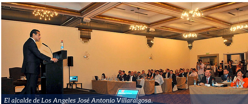
El alcalde de Los Angeles José Antonio Villaraigosa.