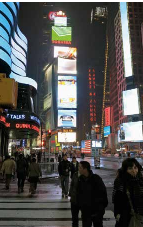
En Nueva York y en Ginza (Tokio) se utilizan plataformas interactivas con pantallas gigantes en las que se informa a la población sobre distintos eventos y noticias de interés para la comunidad.

mación es despachada por los operadores de celulares que envían a sus clientes, vía mensajes de texto, utilizando la tecnología conocida como “emisión por celda”, que difunde los mensajes de forma similar a como se emite la señal de radio o televisión. En Xinjiang (China), las autoridades tienen la posibilidad de saber en tiempo real, por ejemplo, el porcentaje de desempleo de la ciudad, a través de chips instalados en las tarjetas de seguridad social de los ciudadanos.