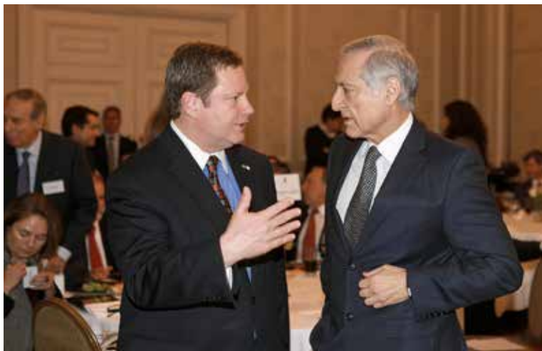
El Embajador de Estados Unidos en Chile, Michael Hammer, participó del encuentro organizado por AmCham. En la imagen, aparece en compañía del Ministro de Relaciones Exteriores, Heraldo Muñoz.

A la espera de la próxima visita de la Presidenta Michelle Bachelet a Estados Unidos, el ministro Heraldo Muñoz declaró su interés porque esa visita tenga un fuerte componente empresarial.