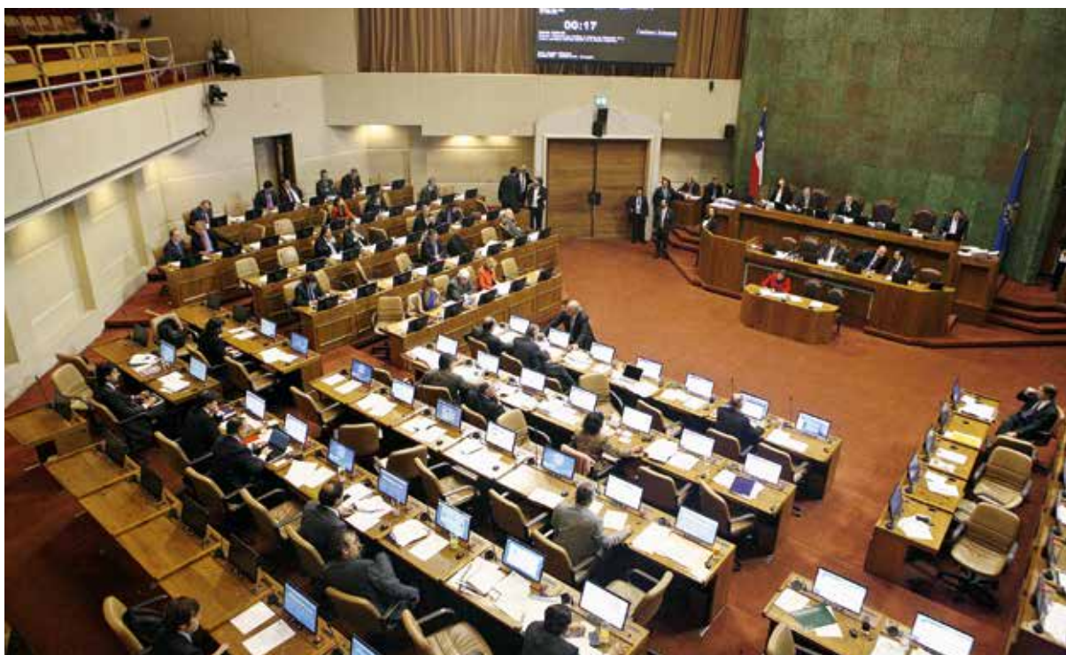
El 13 y 14 de mayo se votó en general y en particular el Proyecto de Ley de Reforma Tributaria en la Cámara de Diputados.

consenso en que, ceteris paribus , la tasa de ahorro del país posiblemente caiga en cerca de un punto porcentual.