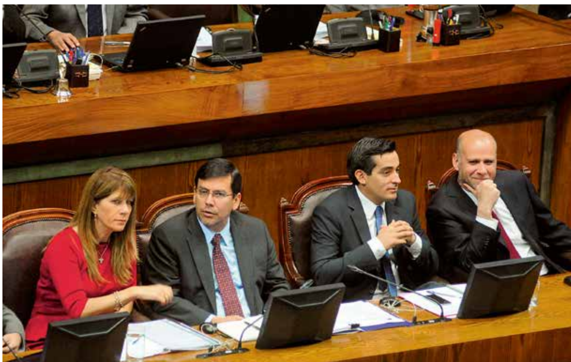
Los ministros, Ximena Rincón (Segpres); Alberto Arenas (Hacienda); Rodrigo Peñailillo (Interior) y Álvaro Elizalde (Segegob), durante la votación del Proyecto de Ley de Reforma Tributaria en la Cámara de Diputados.

Pero ello no cambia el hecho de que sería un nuevo costo para las empresas.