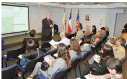
El cónsul Jeffrey Vick durante la charla.

El cónsul Vick destacó que la incorporación de Chile a este programa, uniéndose a otros 37 países del mundo, es una medida que busca afianzar los lazos bilaterales entre ambas naciones y promover aún más el turismo. ■